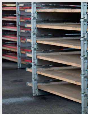
Ingombri minimi in modo ripiegato sia in magazzino che per il trasporto.