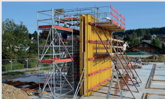
Con il parapetto per la chiusura laterale integrato, elevata sicurezza durante il getto.