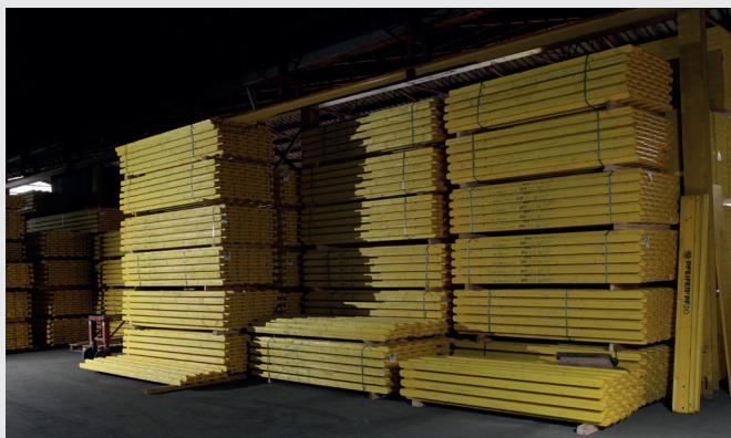
L'ampio assortimento di travi per casseri è disponibile in breve tempo, grazie alle quattro succursali dotate di magazzino.