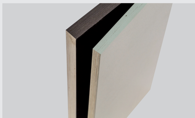
Da sinistra verso destra: Pannelli WISA-Form Birch, WISA-Form-Elephant