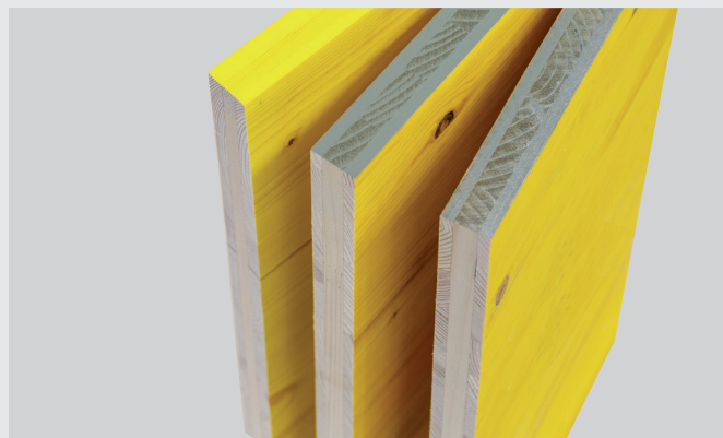
Da sinistra verso destra: 3S P1, 3S T1, 3S BU1

Il pannello è concepito per innumerevoli usi. Se ciò nonostante dovessero verificarsi danneggiamenti, si potranno riparare facilmente. Disponibile un ampio assortimento per la fornitura. Garanzia a lungo termine di 7 anni.