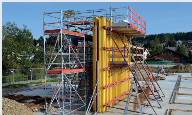
Integrierter Seitenschutz für hohe Sicherheit während dem Betonieren.